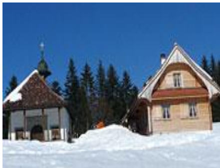
Skihütte St. Jost