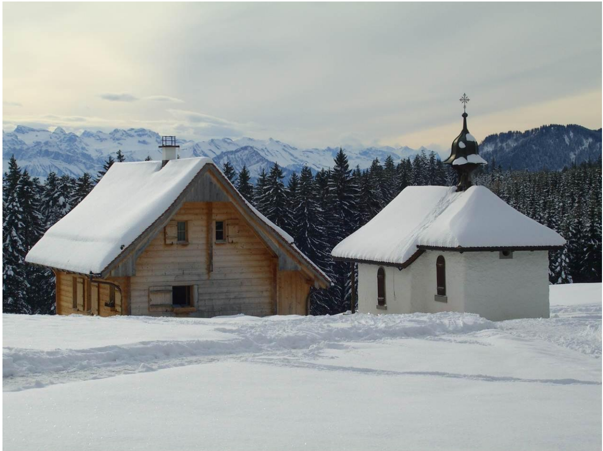
Skihütte St. Jost mit Kapelle