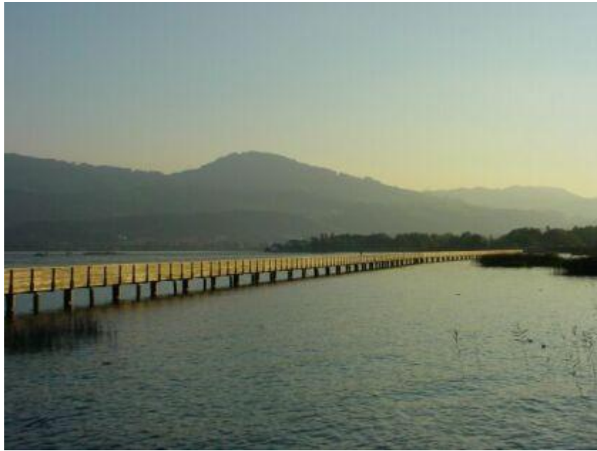
Holzsteg Rapperswil