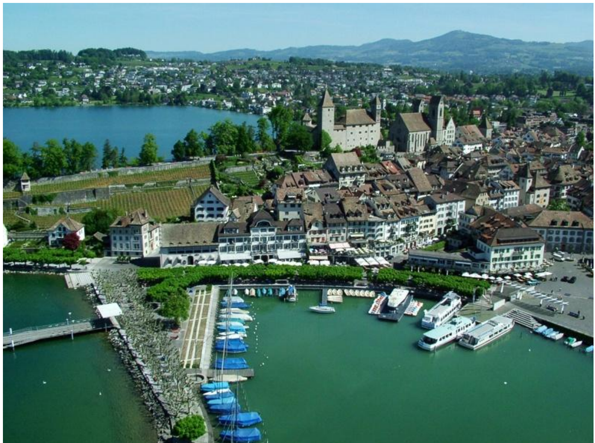
Stadt Rapperswil mit Schloss und Hafenanlage