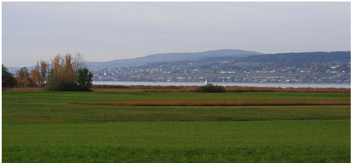
Natur- und Vogelschutzgebiet Frauenwinkel