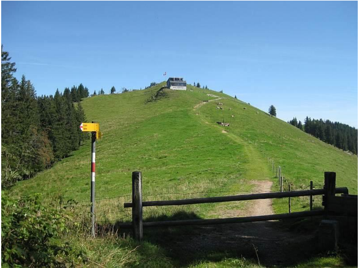
Wanderweg zum Restaurant Wildspitz