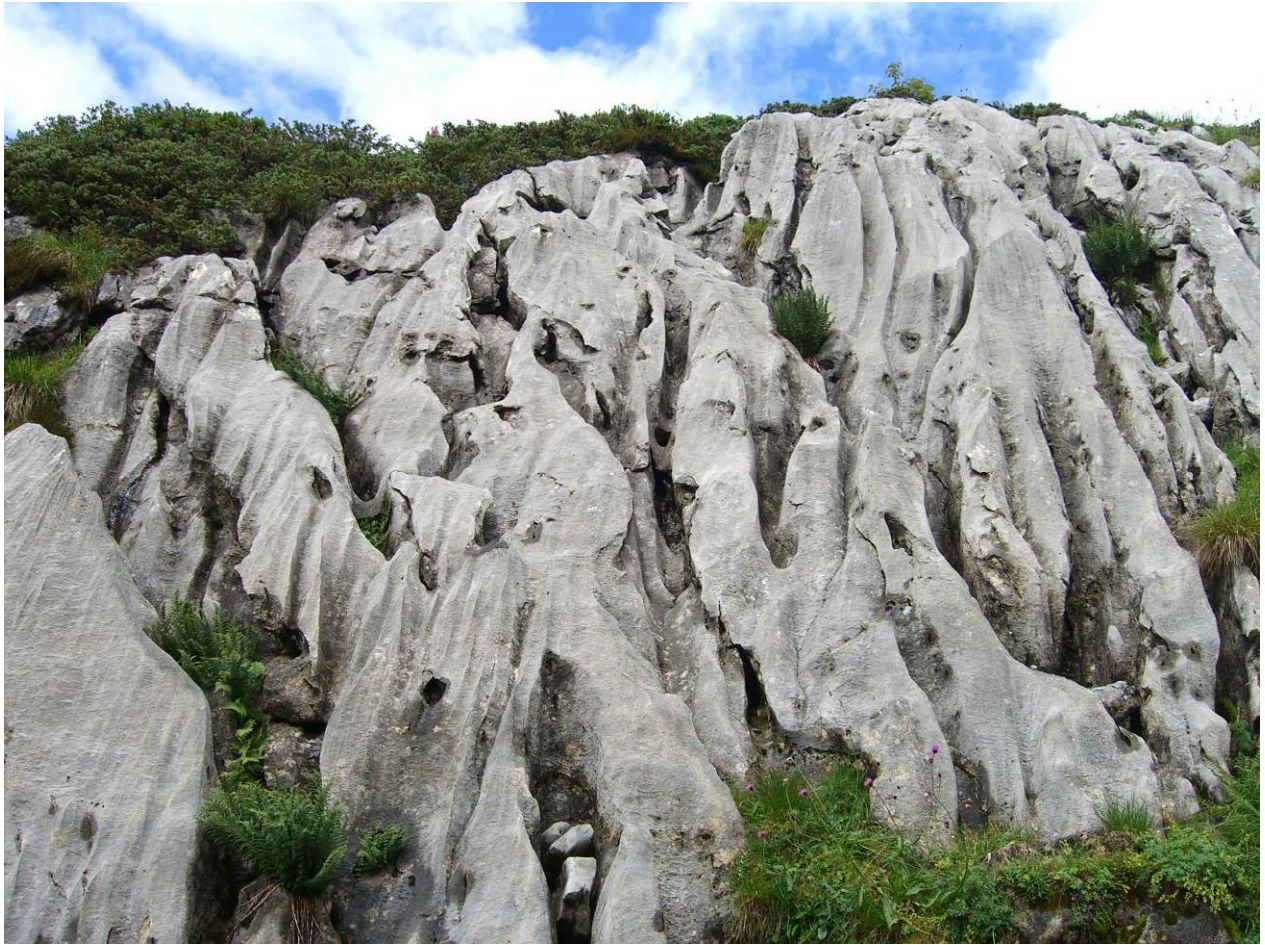
Karstgebiet durch Schratten=Karren zerklüftet