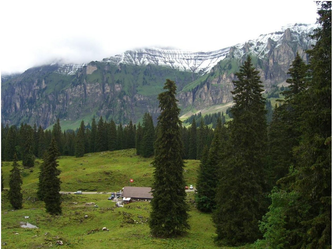
Alpwirtschaft Unter Roggenloch mit Drusberg-Kette im Hintergrund und Säulen-Fichten im Vordergrund