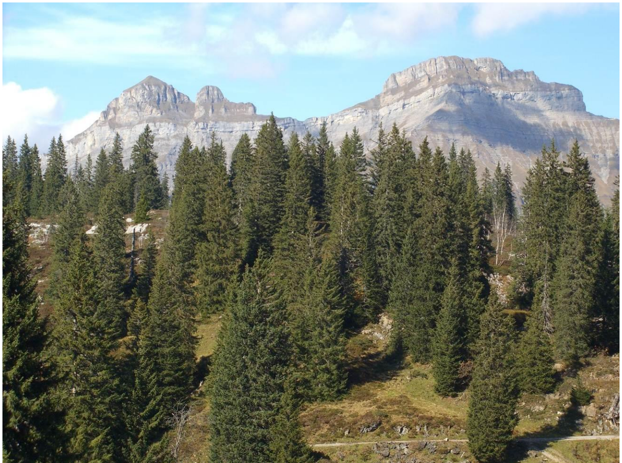
Bödmere Wald mit uralten Fichten