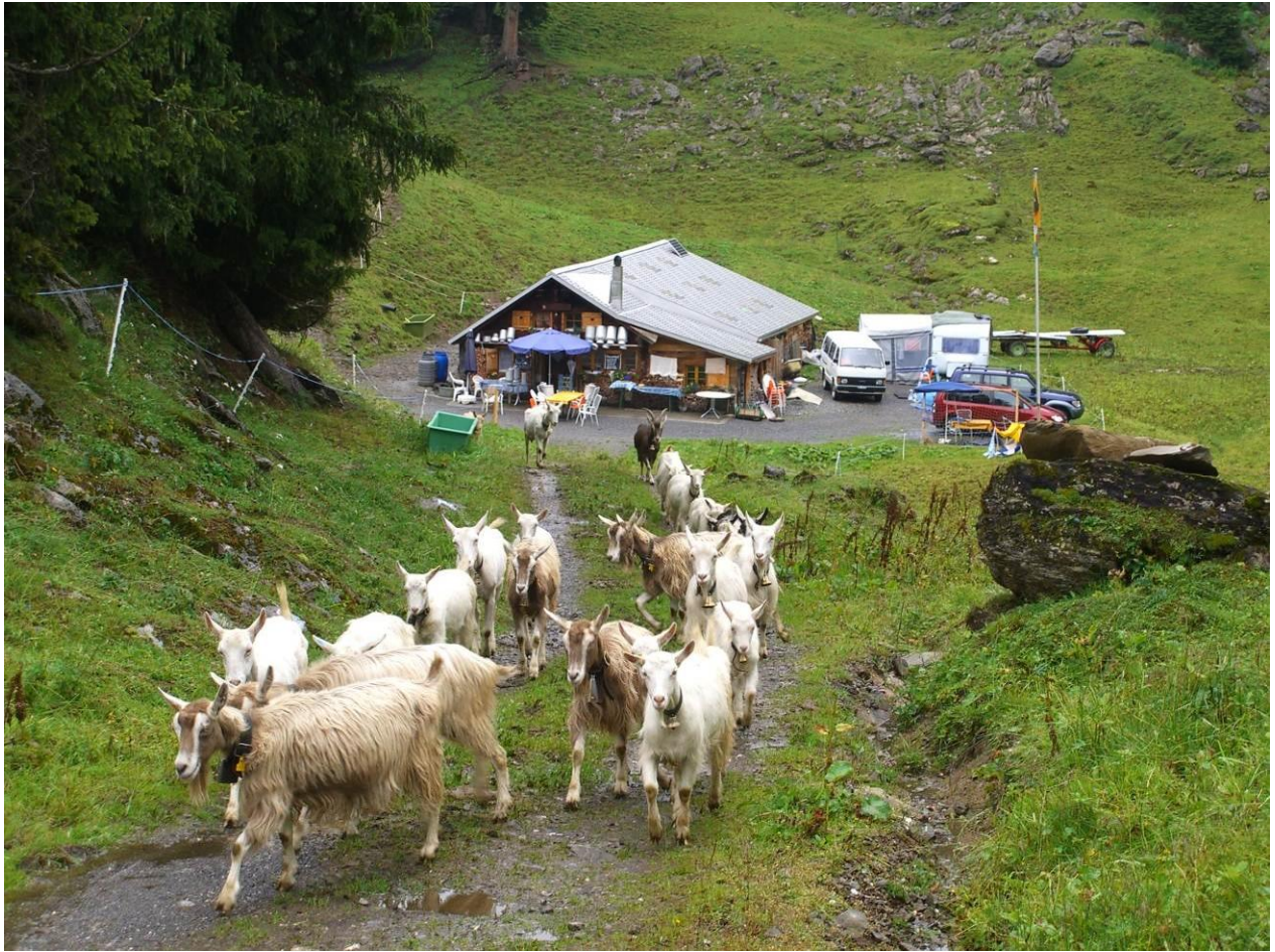
Alpkäserei Ober Roggenloch