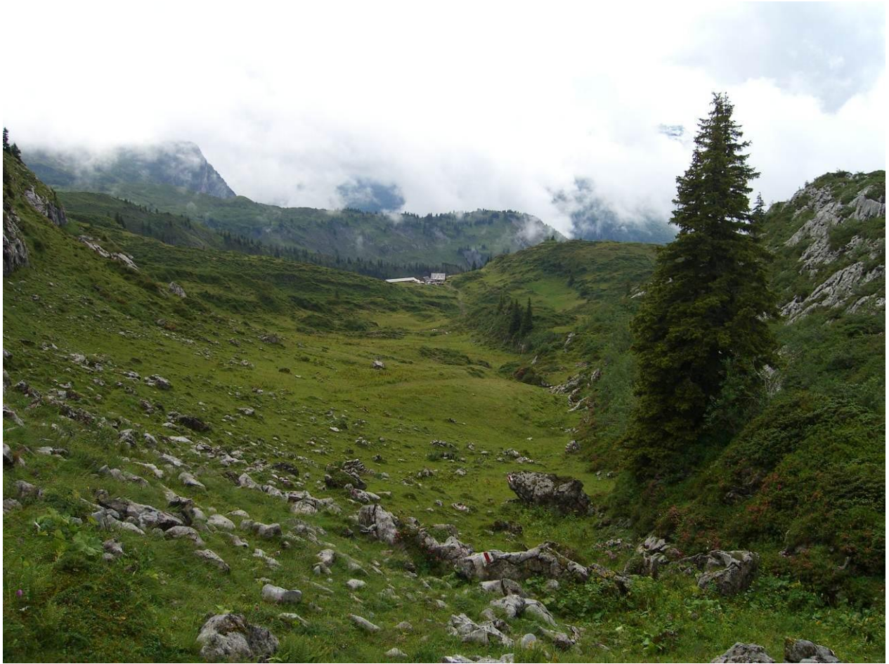
Toralp mit Abedweid im Vordergrund