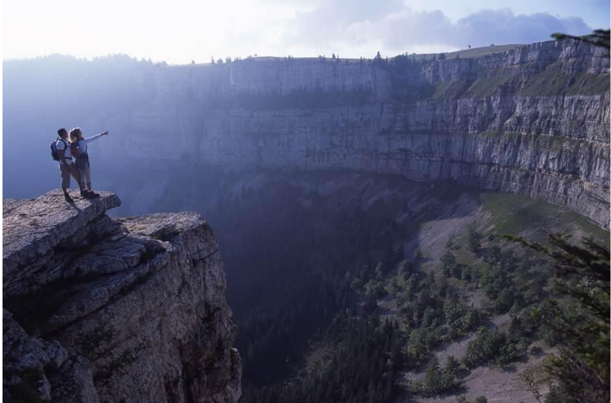
Pied Creux du Van