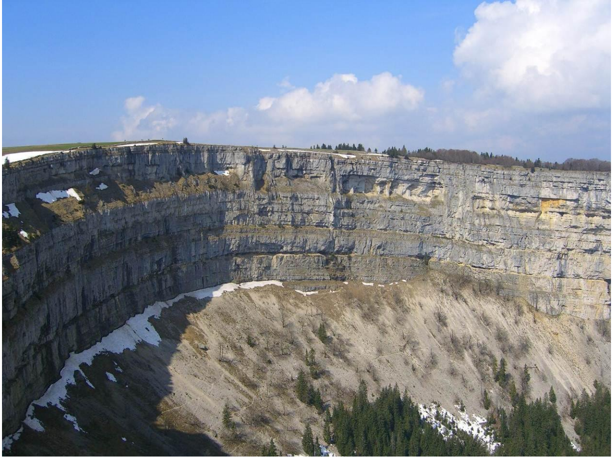
Creux du Van