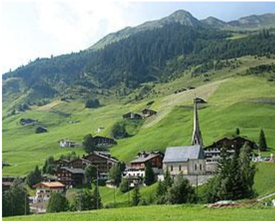
Walsersiedlung St. Antönien