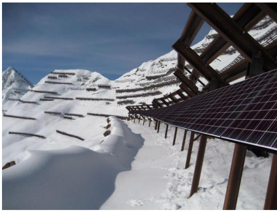
Solarprojekt "Lawinverbauungen" St. Antönien