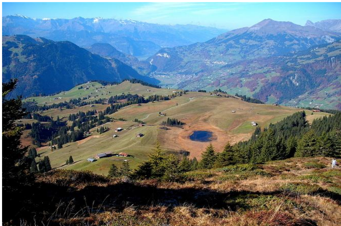
Blick auf Stelserseeli Richtung Landquart vom „Sattel“ aus ( Foto Hrk.org)