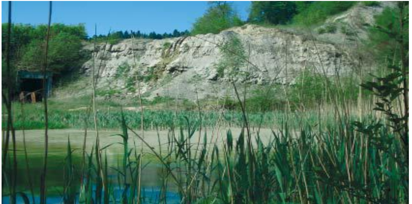
Alte Lehmgrube mit Biotop